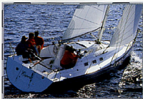
Le FIRST 300 Spirit : Elegant et efficace.

La beauté et l'efficacité vont souvent de pair, et le First 300 Spirit en est un exemple frappant. L'élégance de sa silhouette, la finesse du voile de la quille à hulbe, le gréement élancé concourent tous au potentiel de vitesse de ce voilier de course croisière.